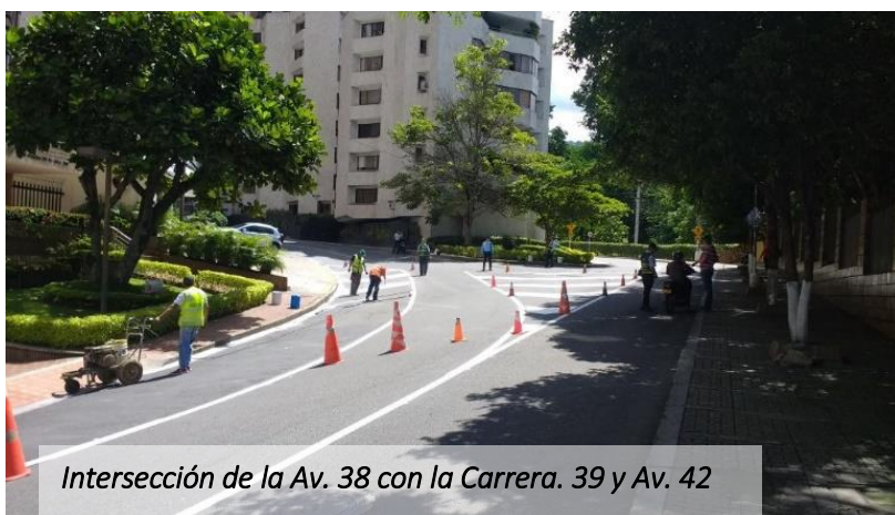
Intersección de la Av. 38 con la Carrera. 39 y Av. 42

Tal como se había anunciado por parte de la Dirección de Tránsito de Bucaramanga –DTB-, este fin de semana se implementaron algunos ajustes a los cambios viales recientemente adoptados en Cabecera del Llano.