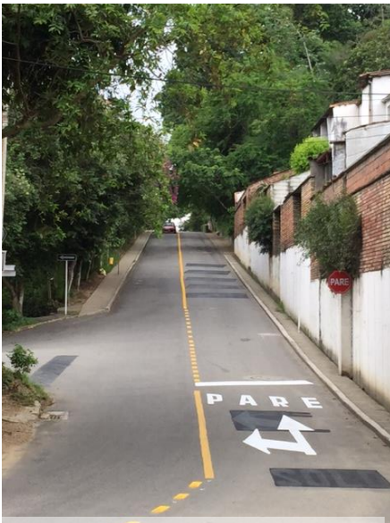
Intersección de la Av. 42 con la Vía a Pan de Azúcar.

Operarios de la DTB realizaron hoy la demarcación de “isletas” y señalización horizontal para la canalización de los vehículos que transitan por la Av. 38. Los que van a tomar la carrera 39 al norte, deben transitar por el carril izquierdo y los que continúan por la Av. 42 deben hacerlo por el carril derecho.