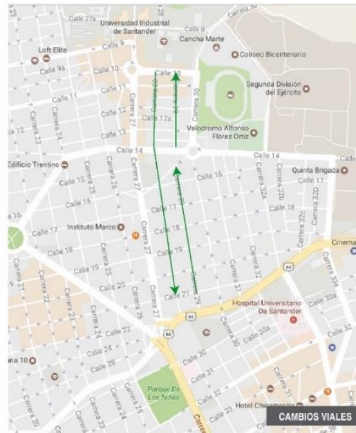
Sentidos viales existentes vs Cambios sugeridos.

Mediante dicho proyecto, que implica la construcción de los primeros 2,6 Km de ciclo-infraestructura para la ciudad, se promueve desde la Administración Municipal y la Oficina de la Bici de la DTB, el uso de la bicicleta como medio de transporte, vehículo que entre otros beneficios permite mejorar la salud de las personas y las condiciones de la movilidad, por cuanto disminuye la contaminación del aire, promueve la actividad física y reduce el espacio que ocupan los ciudadanos en sus desplazamientos.