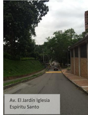
Av. El Jardín Iglesia Espíritu Santo