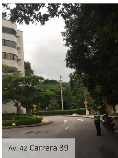
Av. 42 Carrera 39