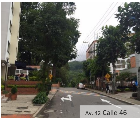
Av. 42 Calle 46

Esté atento a los cambios viales que desde esta semana rigen en la Av. 42 del Barrio Cabecera del Llano y la Av. El Jardín, los cuales fueron implementados por la Dirección de Tránsito de Bucaramanga –DTB- con el fin de brindar mayor seguridad a los peatones del sector.