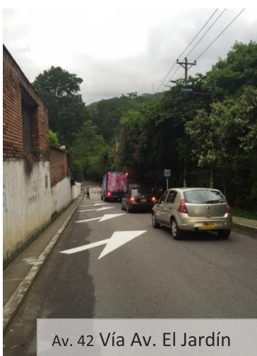
Av. 42 Vía Av. El Jardín

Esté atento a los cambios viales que desde esta semana rigen en la Av. 42 del Barrio Cabecera del Llano y la Av. El Jardín, los cuales fueron implementados por la Dirección de Tránsito de Bucaramanga –DTB- con el fin de brindar mayor seguridad a los peatones del sector.